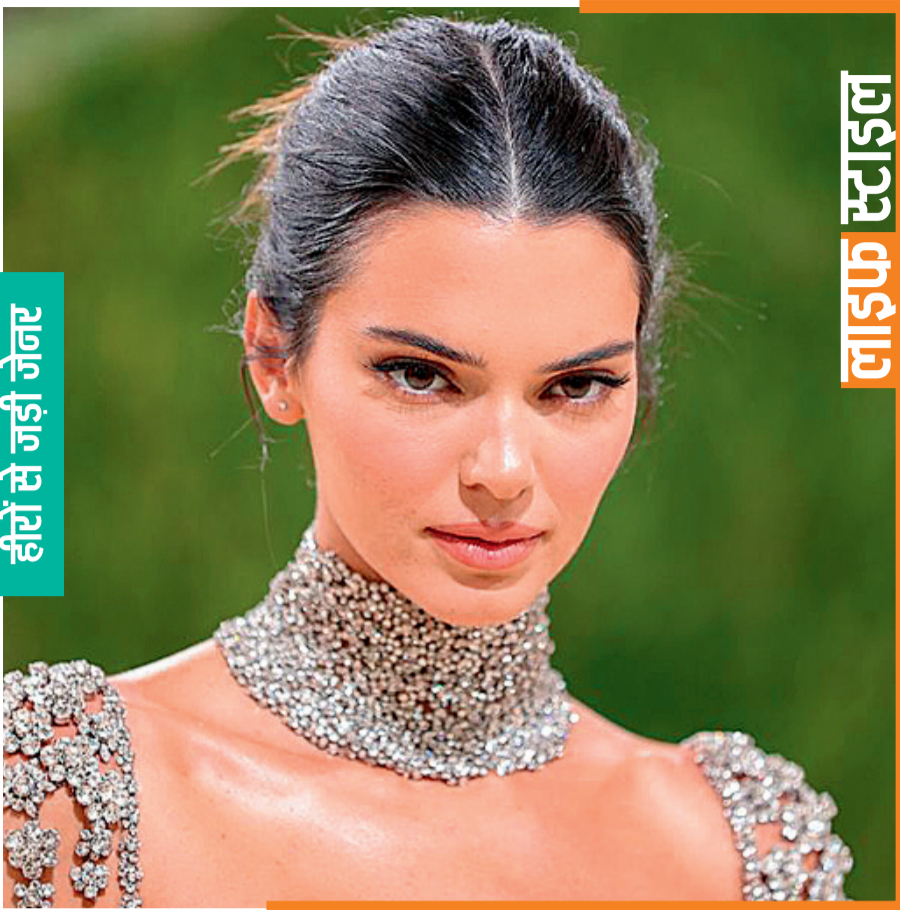
हीरो से जड़ी जेनर

अमेरिकी मॉडल, मीडिया हस्ती और व्यवसायी केंडल निकोल जेनर इन दिनों सुर्खियों में हैं। किस जेनर और ब्रूस जेनर की बेटी केंडल ने फैशन के अलावा अभिनय की दुनिया में भी धूम मचाई है। उन्हें रियलिटी टेलीविजन श्रृंखला कीपिंग अप विद द कार्डशियन से खूब प्रसिद्धि मिली। केंडल अपनी ड्रेस की वजह से भी अक्सर चर्चा में रहती है। हाल ही में हीरो से जड़ी इस ड्रेस के साथ केंडल नजर आईं और उन्होंने मीडिया की खूब सुर्खियां बटोरीं।