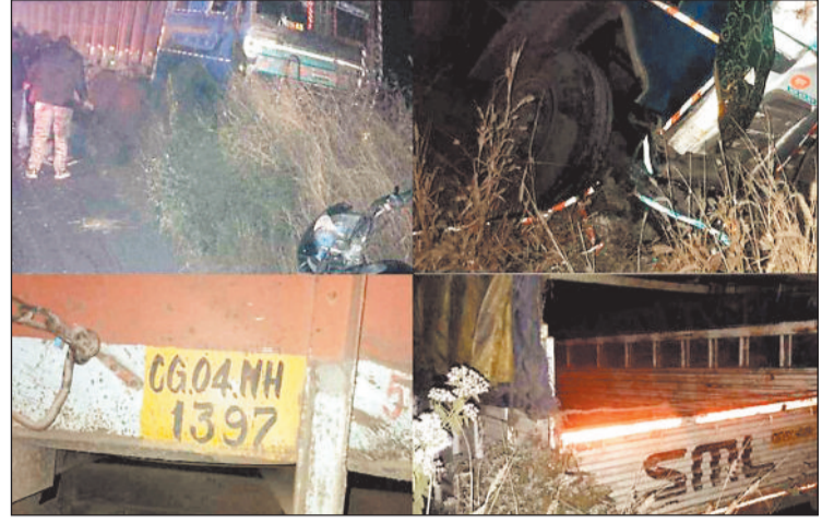
पिकअप और ट्रक की टक्कर के बाद दोनों वाहन क्षतिग्रस्त।

बताया जाता है यह हादसा इतना जबरदस्त था कि ट्रक की चपेट में आने से क्षतिग्रस्त पिकअप चालक समेत उसमें सवार 5 लोग बुरी तरह जखमी होकर उसके भीतर फंसे रहे। सूचना मिलने पर एसपी व एडिशनल एसपी मौके पर पहुंचे और घायलों को बाहर निकाल अस्पताल भेजा जहां डाक्टरी जांच में दो को मृत घोषित कर दिया गया जबकि अन्य का इलाज जारी है। मृतकों की पहचान रायगढ़